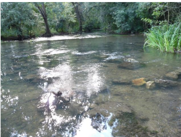
Vallée de l’Auxance coulant sur le Bajocien supérieur