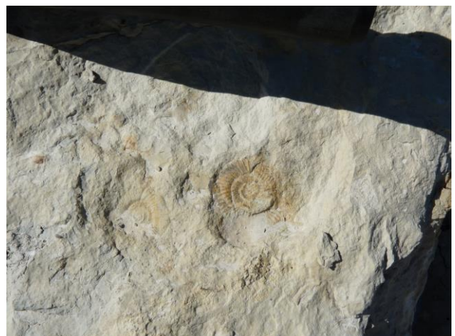
Dalles à ammonites (Callovien)