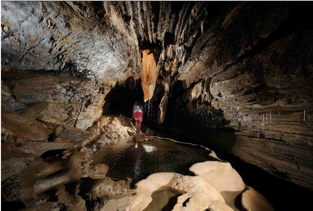
Jeune femme devant le gour étoilé de la rivière souterraine de Cabrespine